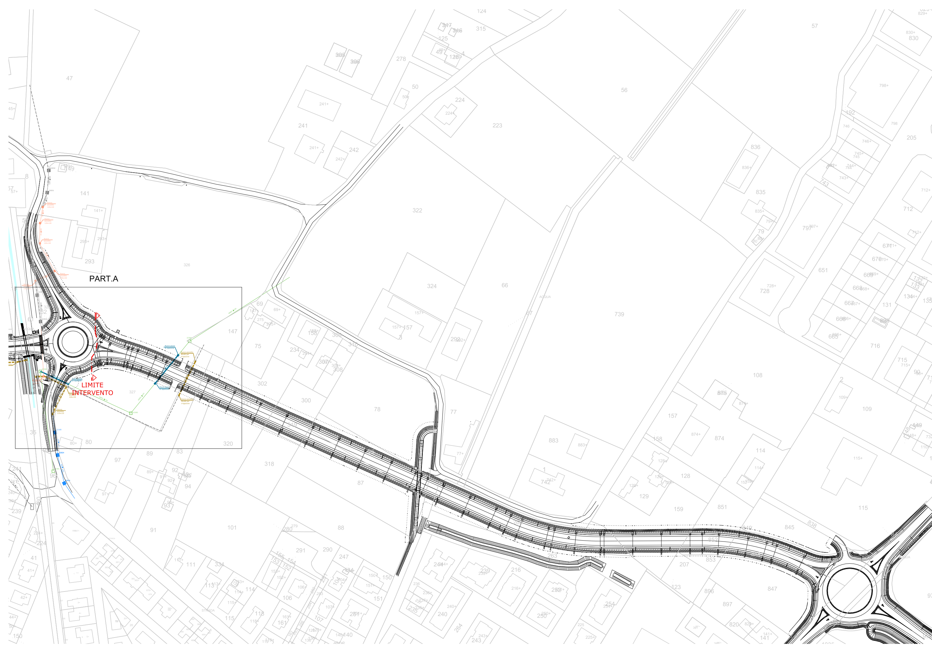
PLANIMETRIA SCALA 1:2000