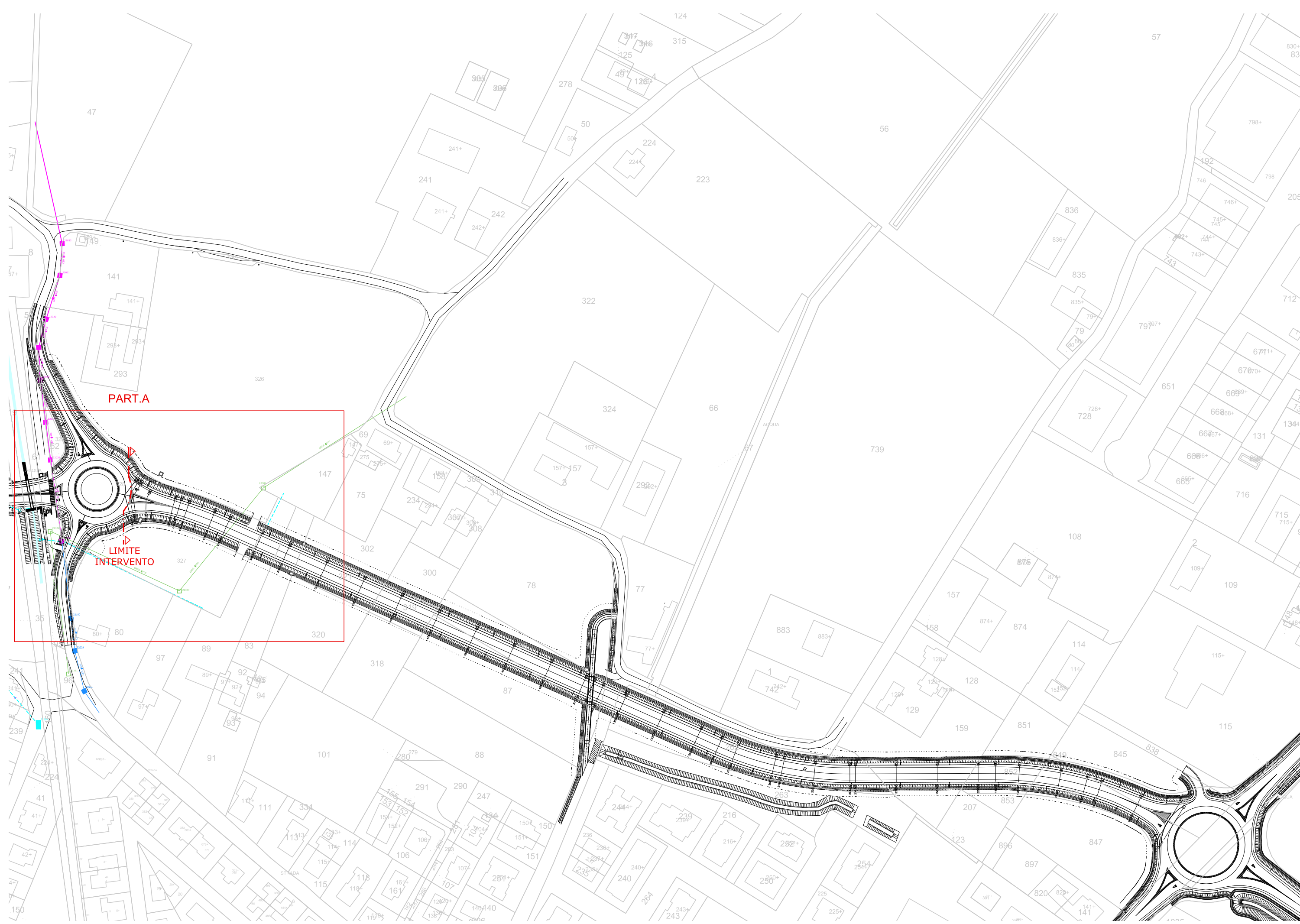
PLANIMETRIA SCALA 1:2000